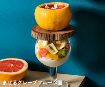
まぜるグレープフルーツ園