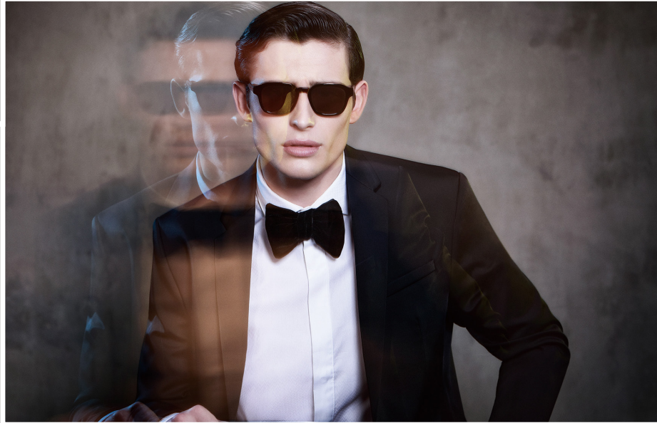
『MASUNAGA designed by Kenzo Takada』