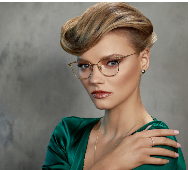
『MASUNAGA since 1905』