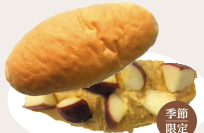
盛岡直送! リンゴソテーと カスタード 240円

薪窯でゆっくり炊き上げた岩手特産の「のだ塩」を効かせた甘さ控えめの自家製ミルククリーム