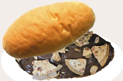
南部せんべい& チョコレート 220円