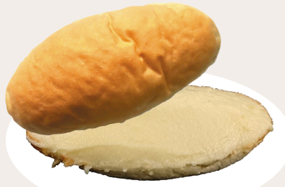
薪窯炊き「のだ塩」 ミルククリーム 190円

チョコクリームに大胆にも岩手名物の「南部せんべい」をあわせた他にはない組み合わせ