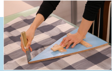
日傘の仕立てでは、柄合わせも重要なポイントになります。社内の職人が一つずつ丁寧に仕立てます。