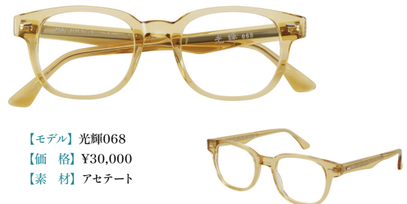
【モデル】光輝068 【価格】¥30,000 【素材】アセテート

1970年に大阪万博のタイムカプセルに収納されたモデルがルーツ。新デザインのテンプルを採用したキーホールブリッジのスクエアシェイプ。飾りパーツや堅牢な丁番、ノーズパッド等、当社伝統のこだわりを盛り込んでいます。プレスによって模様の施されたテンプルコア、合口の飾り、立体的なりベットのデザインが特徴です。