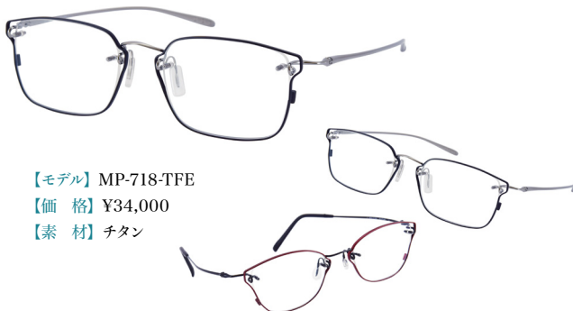
【モデル】MP-718-TFE 【価格】¥34,000 【素材】チタン

川崎和男氏の設計で人間工学に基づいたアイウェアデザイン。リムレスフレームにチタン製のリム飾りをプラスしカワサキリムレスの掛け心地はそのままに、新たなスタイルを表現。彫刻のような造形のブリッジやヨロイパーツは、シンプルながらも立体的に作られており、さりげない存在感を演出します。