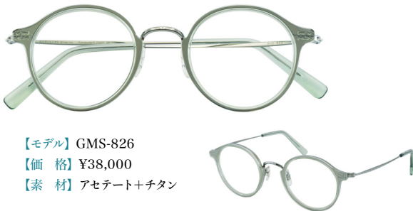
【モデル】GMS-826 【価格】¥38,000 【素材】アセテート+チタン

1933年に昭和天皇献上用として誕生したモデルをルーツとしたシリーズ。軽いチタンベースのフロントにアセテートのインナーリムを組み合わせたコンビネーションフレーム。精巧な金型、プレス技術によってベータチタン製のテンプル、ブリッジ、ヨロイに施された繊細な模様がポイントです。