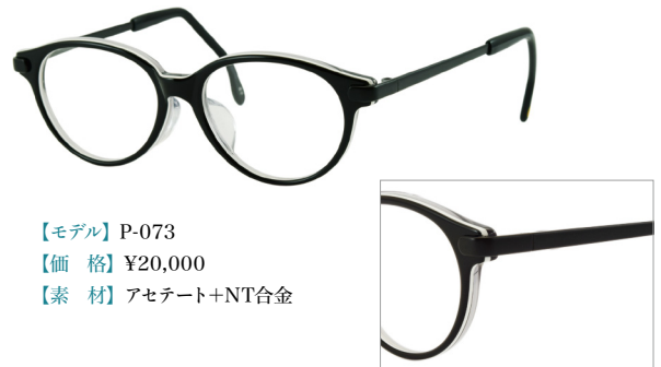
【モデル】P-073 【価格】¥20,000 【素材】アセテート+NT合金

増永のこどもめがねはサイズ・丈夫さ・パーツの形など、30年以上にわたり、お子様の事を常に考えて設計しています。ポストンシェイプにフロントの貼り合わせカラーが可愛さを引き出すキッズフレームです。